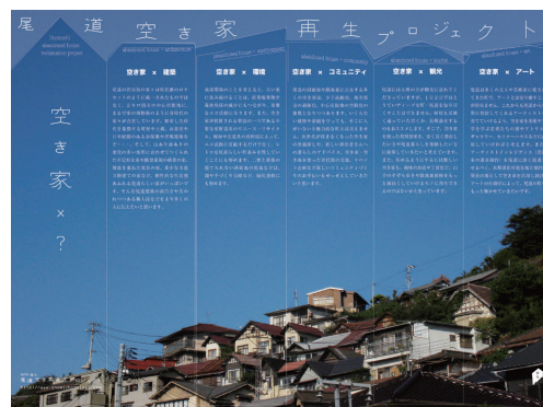
尾道空き家再生プロジェクト