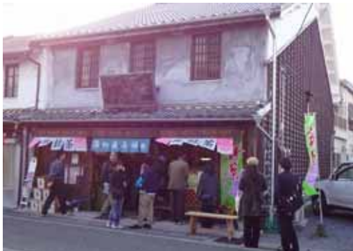
うろんころん高瀬

地道な活動により、「しょうぶまつり」などの通年のイベントも年々観光客の増加が見られ、今後も活動の継続と新しい取り組みの計画・実施を臨みます。