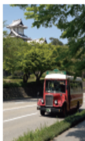
城下まち金沢周遊バス

ルート… 此花ルート、菊川ルート、材木ルート、長町ルート (各ルートともに15分間隔で循環)