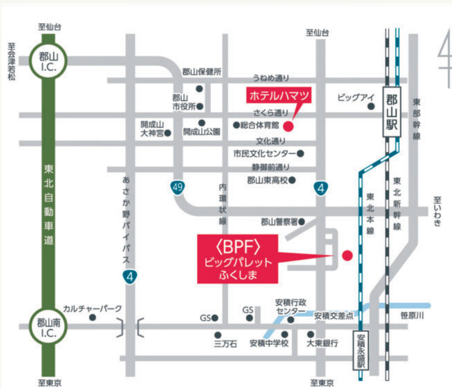
会場(ビッグパレットふくしま)所在地