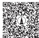
連合会チャンネル