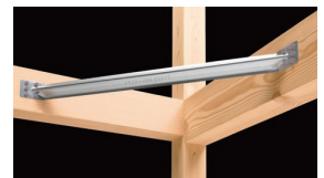
火打ち金物の例