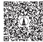
連合会チャンネル